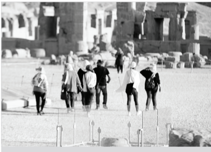
نمای منظر بهارستان